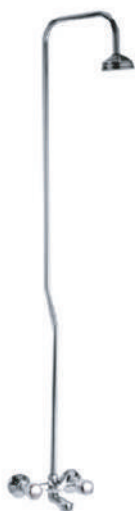
IMMAGINE - IMAGE