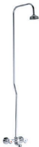
IMMAGINE - IMAGE