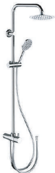
IMMAGINE - IMAGE