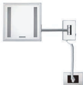
IMMAGINE - IMAGE