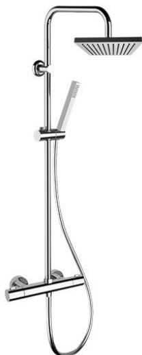
IMMAGINE - IMAGE