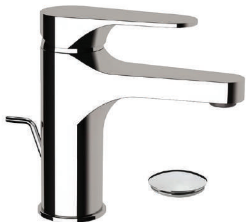
IMMAGINE - IMAGE