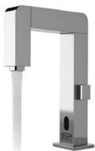
IMMAGINE - IMAGE