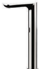
IMMAGINE - IMAGE