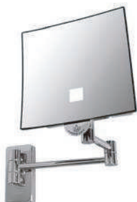
IMMAGINE - IMAGE