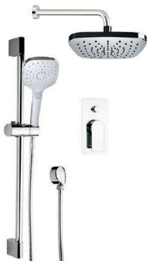
IMMAGINE - IMAGE