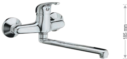
F 41 2 Miscelatore monocomando per lavello a muro, con bocca girevole. Single-lever wall mounted sink mixer, with movable spout.