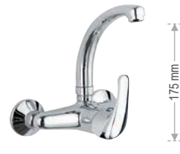
F 43 2 C Miscelatore monocomando per lavello a muro, con leva frontale e bocca alta girevole, modello corto. Single-lever wall mounted sink mixer, with frontal lever and high movable spout, shorter model.