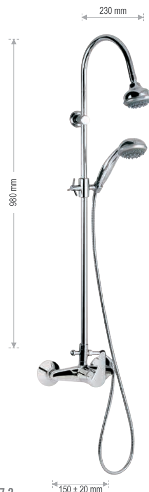
F 37 2 Gruppo doccia con colonna saliscendi e deviatore, completa di doccetta anticalcare 4 getti art. 321GR, flessibile e soffione art. 358GR 4 getti anticalcare. Shower wall mounted mixer with deluxe sliding rail column and diverter, complete with handshower anti-limestone 4 jets art. 321GR, flexible hose and shower head art. 358GR, 4 jets, anti-limestone.