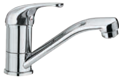
F 11 2 G Miscelatore monocomando per lavabo o lavello, con bocca girevole. Single-lever one-hole basin or sink mixer, with movable spout.