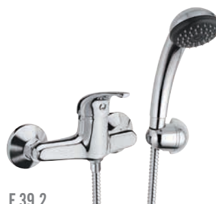
F 39 2 Miscelatore monocomando esterno per doccia, con doccia duplex. Wall mounted single-lever shower mixer, with duplex shower.