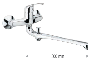
F 46 2 Miscelatore lavabo/vasca con canna fusa lunga 30 cm e deviatore senza kit doccia.

Wall basin/bath single lever mixer with 30 cm long casted spout with diverter without duplex shower.