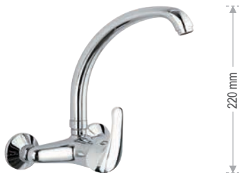
F 43 2 Miscelatore monocomando per lavello a muro, con leva frontale e bocca alta girevole. Single-lever wall mounted sink mixer, with frontal lever and high movable spout.