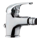
F 20 2 Miscelatore monocomando per bidet con aeratore direzionabile. Single-lever bidet mixer with adjustable aerator.