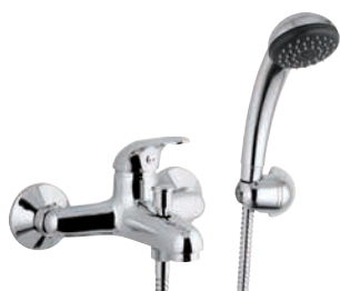
F 02 2 Miscelatore monocomando per vasca, esterno, con doccia duplex.

Single-lever bath mixer with duplex shower.