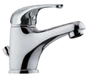
F 10 2 Miscelatore monocomando per lavabo. Single-lever basin mixer.