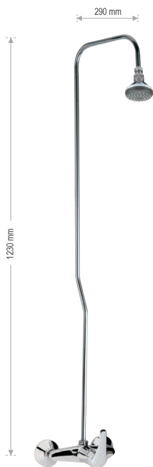
F 36 2 EX Gruppo doccia con colonna 329 EX, e soffione doccia art. 351 A, anticalcare. Shower wall mounted mixer with 329 EX pipe and shower head art. 351 A, anti-limestone.