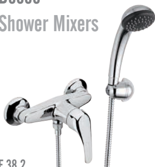
F 38 2 Miscelatore monocomando esterno per doccia, con leva frontale e doccia duplex. Wall mounted single-lever shower mixer, with frontal lever and duplex shower.