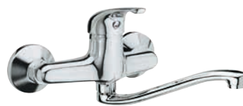
F 41 2 S Miscelatore monocomando per lavello a muro, con bocca a "S" girevole. Single-lever wall mounted sink mixer, with "S" movable spout.