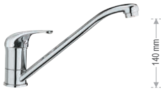
F 40 2 Miscelatore monocomando per lavello, con bocca girevole. Single-lever one-hole sink mixer, with movable spout.