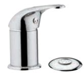
F 23 2 Miscelatore monocomando per bidet, con doccia. Single-lever bidet mixer with spray.