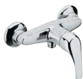
F 33 2 Miscelatore monocomando esterno per doccia, con leva frontale. Wall mounted single-lever shower mixer, with frontal lever.