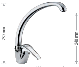
F 42 2 Miscelatore monocomando per lavello, con bocca alta girevole. Single-lever one-hole sink mixer, with high movable spout.