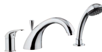
F 07 2 Miscelatore monocomando bordo vasca serie 35 con deviatore, bocca fusa e doccetta.

Single lever deck bath/shower mixer serie 35 with diverter, with casted spout and chrome plated hand shower.