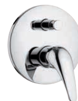
F 09 2 Miscelatore monocomando da incasso con deviatore per vasca/doccia.

Built-in bath/shower single-lever mixer with diverter.