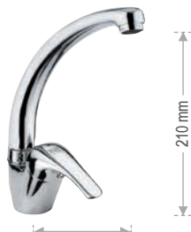
F 42 2 C Miscelatore monocomando per lavello, con bocca alta girevole, modello corto. Single-lever one-hole sink mixer, with high movable spout, shorter model.