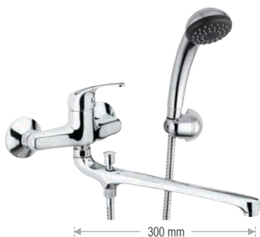
F 49 2 Miscelatore lavabo/vasca con canna fusa lunga 30 cm e deviatore con kit doccia.

Wall basin/bath single lever mixer with 30 cm long casted spout with diverter with duplex shower.