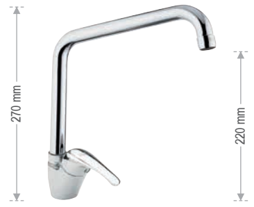
F 42 2 U Miscelatore monocomando per lavello, con bocca alta a "U" girevole. Single-lever one-hole sink mixer, with high "U" movable spout.