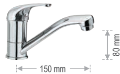
F 11 2 G Miscelatore monocomando per lavabo o lavello, con bocca girevole. Single-lever one-hole basin or sink mixer, with movable spout.