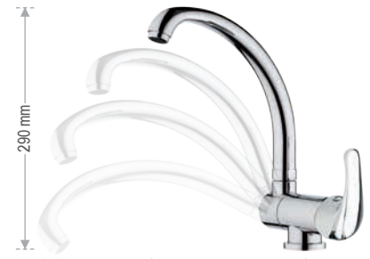
F 42 2 R Miscelatore monocomando monoforo 90° per lavello, con bocca alta, tipo lusso, modello sottofinestra. Single-lever one-hole sink mixer, with high spout, luxury type, under window type.