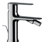
V 20 Miscelatore monocomando bidet. Single-lever bidet mixer.