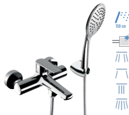
V 02 Miscelatore vasca esterno con kit doccia, flessibile 150 cm. Exposed bath mixer with shower kit, flexible 150 cm.