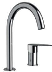
V 57 Miscelatore monocomando lavabo due fori. Two holes single-lever washbasin mixer.