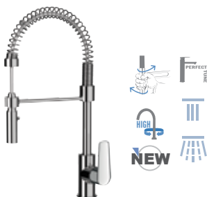
V 77 E Miscelatore monocomando lavello a molla con doccetta estraibile dal supporto ed orientabile a due funzioni e cartuccia Ø 35. Spring single-lever sink mixer with detachable and adjustable 2-functions hand shower and Ø 35 mm cartridge.