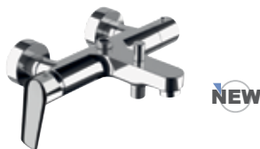
V 34 Miscelatore vasca/doccia con attacco alto da 1/2" ed attacco inferiore da 1/2". Bath/shower mixer with upper 1/2" connection and lower connection 1/2".