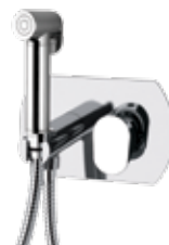
V 60 W Miscelatore incasso per shut-off comprensivo di: doccetta shut-off art. 332OW, supporto doccia-presa acqua su piastra in ottone cromato e flessibile doccia cm 120. Built-in shower mixer set including :shut-off art. 332OW, shower holder-water punch on flange, all in c.p. brass and shower flexible cm 120.