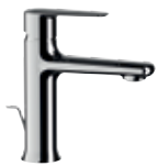
V 10 Miscelatore monocomando lavabo. Single-lever basin mixer.