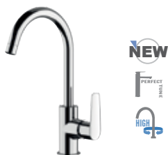
V 72 Miscelatore monocomando monoforo 90°, con canna alta a "U". Single-lever sink mixer 90°, high "U" spout.