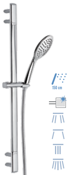
317V 315P3I Saliscendi cromato con asta minimale ovale, con doccetta anticalcare a 4 funzioni, pulsante per il cambio dei getti anticalcare in silicone, flessibile in acciaio inox. C.p. sliding rail set with minimal oval rod and anti-limestone 4 functions with button to change the jets handshower and flexible hose in stainless steel.