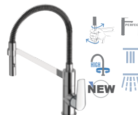
V 533 Miscelatore lavello monocomando con flessibile nero rivestito con molla "fine design" girevole 360°, con doccetta estraibile di supporto ed orientabile a due funzioni e cartuccia Ø 35. Single-lever mixer with black flexible hose coated with "fine design" spring, 360° movable, with detachable and adjustable 2-functions hand shower and Ø 35 mm cartridge.