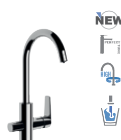
V 79 DW Miscelatore lavello a tre vie di ingresso con bocca girevole e due vie d'uscita completamente indipendenti, con selezione acqua potabile tramite la leva. Three ways inlet single lever sink mixer, with movable spout and two fully independent outlets, with selection for drinking water directly from the lever.