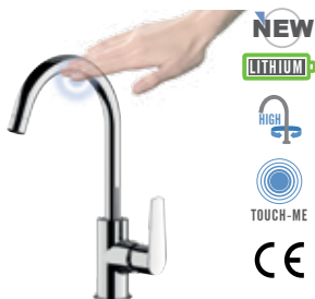
VT 72 Miscelatore monocomando lavello, monoforo 90° con canna alta ad "U" dotata di tecnologia Touch-Me con leva laterale e bocca girevole. Dotato di cartuccia Ø35. Single-lever sink mixer 90°, high "U" spout equipped with Touch-Me system with side lever and movable spout. Equipped with Ø35 cartridge.