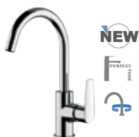
V 72 C Miscelatore monocomando per lavello, con canna corta a "U", tipo lusso. Single-lever one-hole sink mixer, with short "U" spout, luxury type.