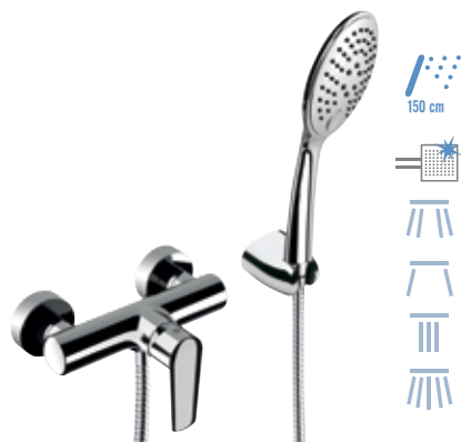
V 38 Monocomando doccia esterno con kit doccia. Exposed shower mixer with shower kit.