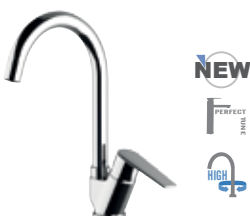
V 42 B Miscelatore monocomando per lavello, con bocca alta girevole. Single-lever one-hole sink mixer, with high movable spout.