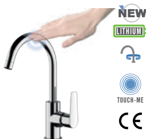
VT 72 C Miscelatore monocomando lavello, monoforo 90° con canna corta ad "U" dotata di tecnologia Touch-Me con leva laterale e bocca girevole. Dotato di cartuccia Ø35. Single-lever sink mixer 90°, short "U" spout equipped with Touch-Me system with side lever and movable spout. Equipped with Ø35 cartridge.