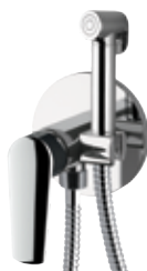
V 65 W Miscelatore incasso shut-off. Built-in shower mixer set.