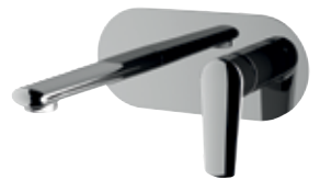
V 15 Miscelatore monocomando a incasso per lavabo, con piastra orizzontale in ottone cromato. Single-lever built-in basin mixer, with horizontal wall flange in chrome plated brass.